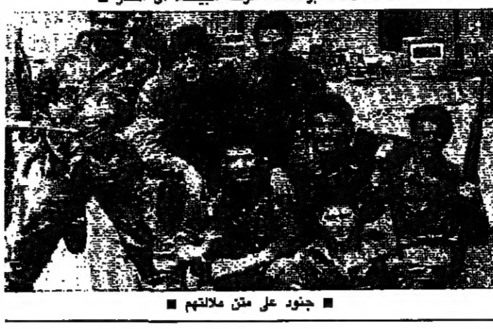
جنود على متن ملائمتهم